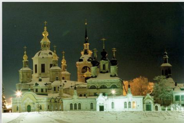
Родной Великий Устюг

российские профильные выставки, изучали и перенимали опыт других газовых компаний. Правильным решением было введение должности инженера по внедрению новых технологий. Благодаря всему этому «Устюггаз» в течение пяти лет признавался лучшим газовым предприятием России. Компания «Устюггазсервис» одной из первых в России запустила строительство газопроводов из полиэтилена. В свое время это был рискованный и смелый шаг, но мы его сделали и не по-