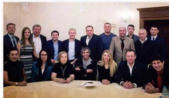
Клуб делового общения с Бари Алибасовым

Высшее образование получил заочно в Ленинградской Лесотехнической академии. Начав работу слесарем-сантехником в Великоустюгском «Межрайгазе», через некоторое время стал директором. Я поставил перед собой задачу сделать «Межрайгаз» передовым предприятием в отрасли, обновил коллектив. Мы посещали все-