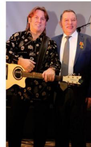
Исполнилось желание молодости. На юбилей именинника была спета любимая песня «Плот» в исполнении автора Юрия Лозы

В городах, с которыми компания «Устюггазсервис» сотрудничает, мы устанавливаем уличные спортивные площадки из антивандальных тренажеров. Мною был разработан типовой проект таких площадок. На них любой желающий может заняться физкультурой под открытым небом совершенно бесплатно. Не у всех есть возможность покупать абонементы в тренажерный зал, тем более что в основном на площадках занимаются дети и молодежь. В 2014 году мы установили спортивный комплекс в Устюге в Комсомольском сквере и в Вологде на улице Прокатова. Решение сделать такой подарок Вологде было принято на клубном мероприятии. В этом году тренажерную площадку «Устюггазсервис» поставил в Верховажье и Северодвинске, на очереди село Урдома Архангельской области.