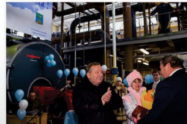
Губернатор Алтайского края награждает часами и медалью за заслуги во имя совидания Алтайского края